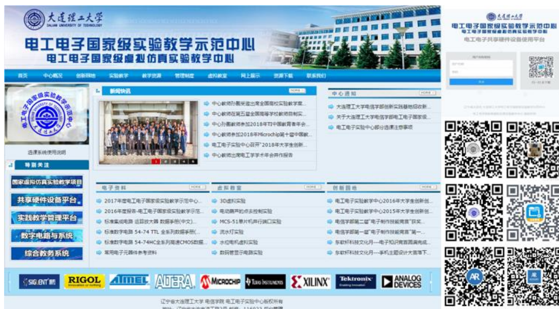
图3 示范中心网站及信息化平台