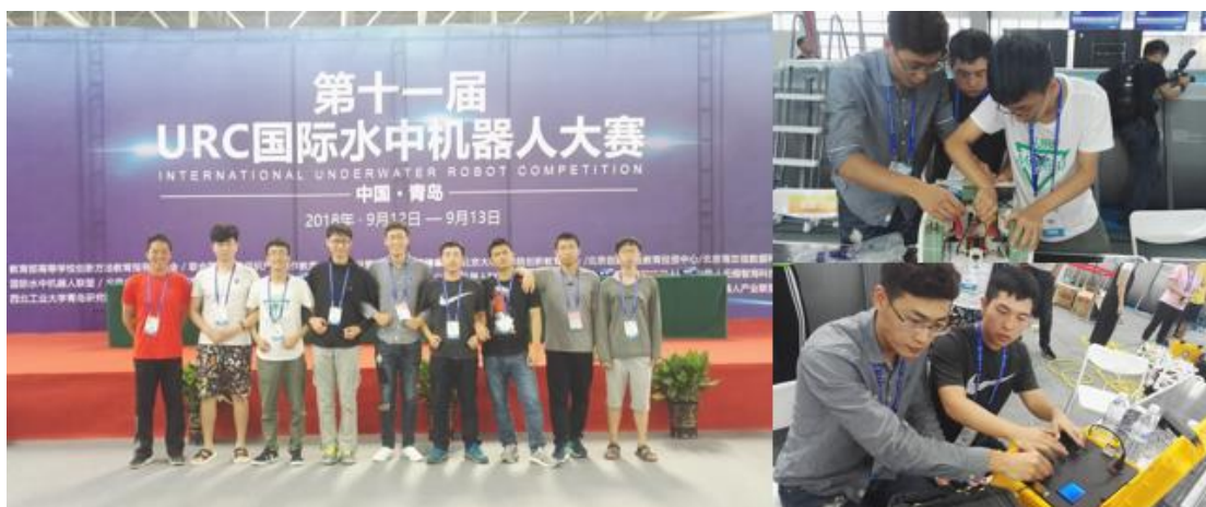
图 8 比赛现场

5. 2018年9月12日，第十一届国际水中机器人大赛在青岛拉开帷幕。来自电工电子实验中心大学生创新实践基地的本科生参赛队在水中机器人作业的比赛中获得亚军。国际水中机器人大赛是由北京大学软件工程国家研究中心及国际水中机器人联盟共同举办的国际学科竞赛，参赛学校数量百余所。