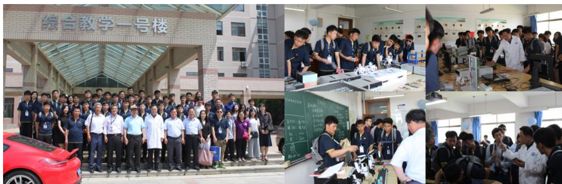
图 13 来访现场

11. 2018年6月11日，自动化专业认证专家组来访电工电子实验教学中心，实地考察中心实验教学工作。专家对中心的实验设备、实验水平、实验教师素养等都给予了高度评价，对中心的实验教学改革工作给予了充分的认可。