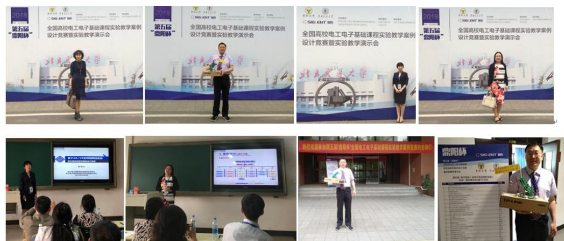
图 18 比赛现场

14. 2018年5月5日，由教育部电工电子基础课程教学指导委员会与国家级实验教学示范中心联席会联合举办的第五届全国电工电子基础课程实验教学案例设计竞赛（鼎阳杯）暨实验教学演示会在北京交通大学逸夫楼进行了紧张的决赛。本次竞赛参赛案例298件，最终共有20个省份87所高校的202件案例进入复赛，我校电工电子实验教学中心程春雨老师和巢明老师的案例设计均获得全国一等奖、商云晶老师和姜艳红老师的案例分别获得二等奖和三等奖。