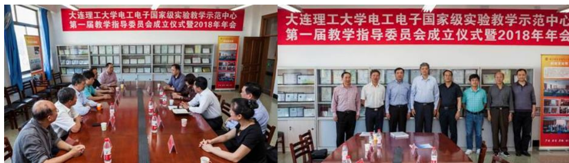
图 17 会议现场