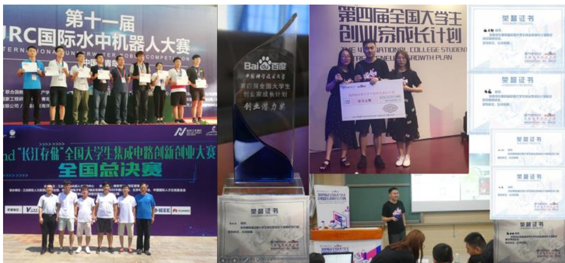
图1 学生参赛部分获奖情况

中心注重创新与实践教育，积极组织学生参加各类竞赛活动，使优秀学生脱颖而出，在国际、国内各级电子类竞赛中取得了丰硕成果。本年度中心教师指导学生在省部级以上竞赛获奖49人次，包括：国际水中机器人大赛一等奖；中国机器人大赛一等奖；全国大学生集成电路创新创业大赛二等奖；全国大学生智能汽车竞赛二等奖；全国大学生创业家成长计划创业组二等奖；全国“TRIZ”杯大学生创新方法大赛三等奖等国际级、国家级和省级奖项。学生的创新、协作等综合能力得到显著提高。