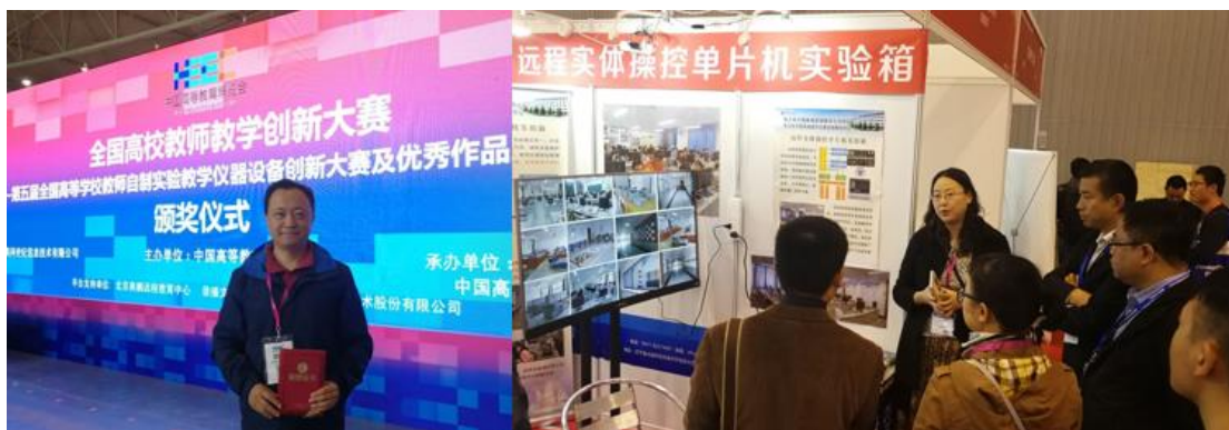
图 5 比赛现场

3. 2018 年 10 月 27 日，中国高等学校电工学研究会第十七届学术年会于杭州召开，电工电子实验教学中心王开宇老师应邀作了题为“电工电子虚拟仿真实验教学项目建设及创新人才培养”的大会报告，详细介绍了虚拟仿真实验教学项目的建设方案及创新手段，报告内容使与会者们深受启发，受到参会者广泛关注。