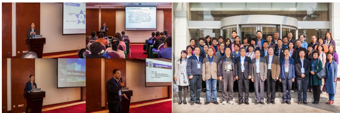
图 7 会议现场

5. 2018年9月12日，第十一届国际水中机器人大赛在青岛拉开帷幕。来自电工电子实验中心大学生创新实践基地的本科生参赛队在水中机器人作业的比赛中获得亚军。国际水中机器人大赛是由北京大学软件工程国家研究中心及国际水中机器人联盟共同举办的国际学科竞赛，参赛学校数量百余所。