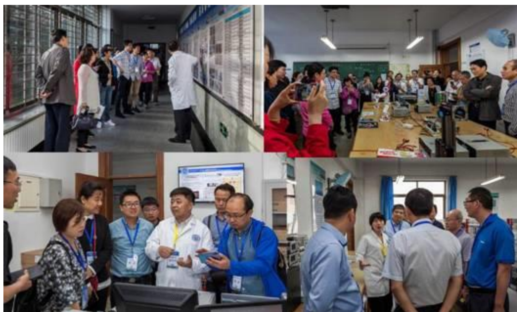
图 16 来访现场