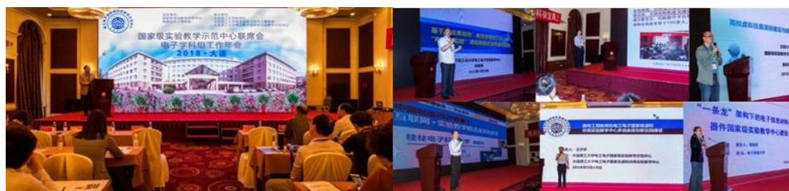
图 15 会议现场

会后，全体代表参观了电工电子国家级实验教学示范中心，代表们对中心近年来在实验室环境建设和人才培养工作方面日新月异的变化予以高度赞扬。本次会议为各示范中心代表提供了一个学习、交流和展示平台，更是对大连理工大学电工电子实验教学中心实验教学改革和实验室建设的一次检验、推广和辐射，必将对今后中心的实验教学、实验室建设和人才培养产生积极而深远的影响。