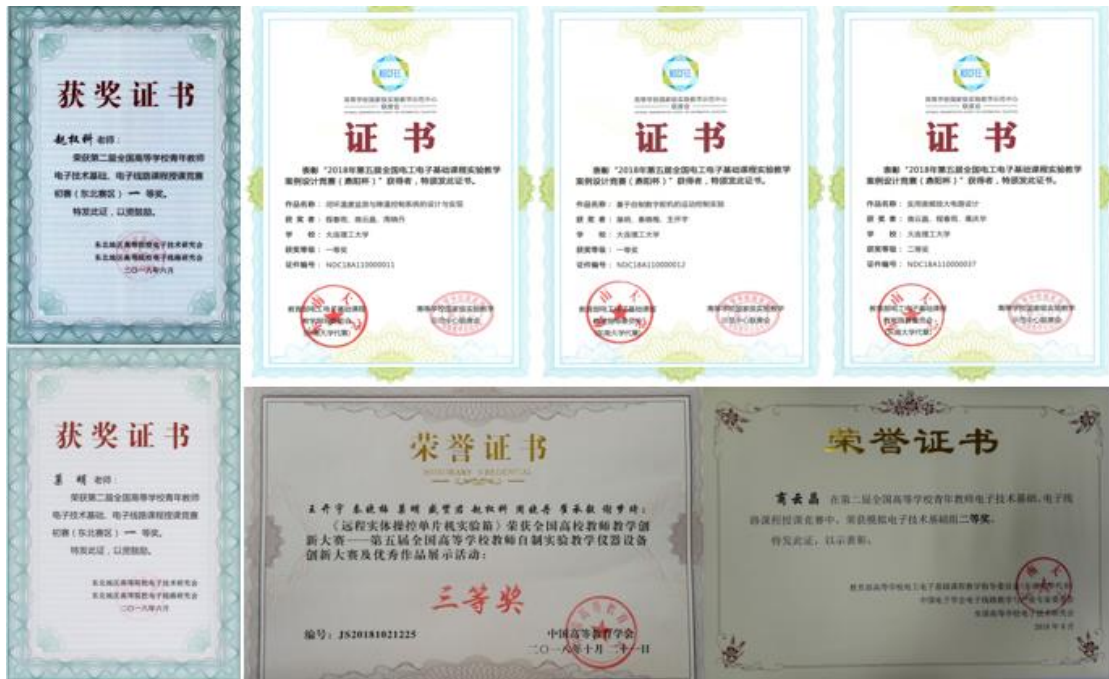
图 2 教师部分获奖证书